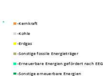
Gesamtstromlieferung der Gemeindewerke Waging a. See

Stromkennzeichnung gem. § 42 Energiewirtschaftsgesetz vom 7. Juli 2005 geändert am 10.08.2021